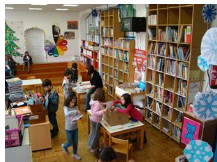
Os alunos podem ir regularmente à BCD (Biblioteca) para consultar e requisitar livros.

Os alunos da escola elementar podem utilizar diferentes salas especializadas: sala de informática, sala polivalente, BCD.