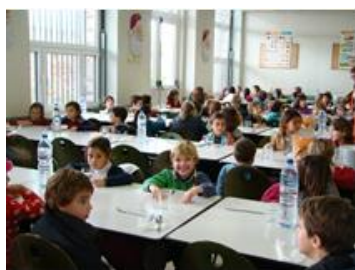
Os CP são servidos à mesa.

Às 11h15 ou 11h30, os alunos comem no restaurante escolar : os CP são servidos à mesa e os mais crescidos servem-se no «self service».