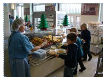
Les plus grands se servent au self.